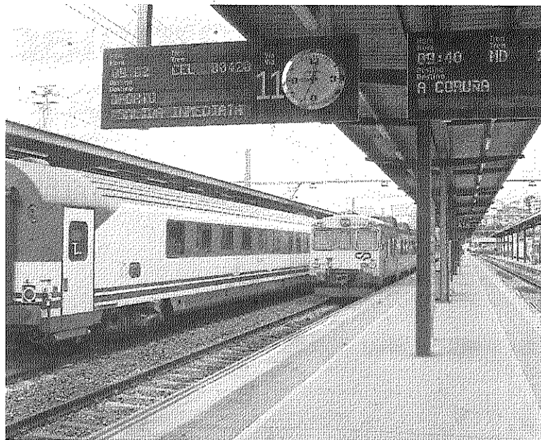
La estación de larga distancia de Vigo-Areal.

Entre los ya confirmado se encuentran el tren Alvia con salida de Madrid-Chamartín a las 7,12 horas y llegada a Vigo y Pontevedra a las 14,10 horas, el Alvia con salida de Pontevedra-Vigo a las 8,15 horas y llegada a Madrid-Chamartín a las 15,06 horas, el Alvia (que circula los sábados) con salida de Pontevedra a las 8,15 horas y llegada a Madrid-Chamartín a las 15,08 horas, el Alvia con salida de Pontevedra a las 15,35 horas y llegada a Madrid-Chamartín a las 23,22 horas y el Alvia con salida de Madrid-Chamartín a las 16,28 horas y llegada a Pontevedra a las 23,09 horas.