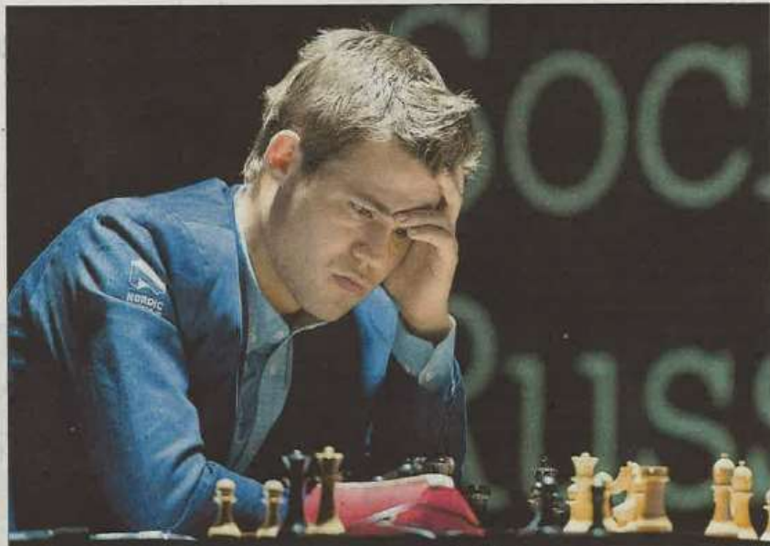
Carlsen, en un momento de la partida de ayer.

El Kárpov de los mejores tiempos hubiera ganado probablemente esta partida con las piezas de Anand. Pero éste no pudo controlar sus nervios y cometió dos errores: primero no vio una jugada difícil, pero no tanto como la que acababa de hacer, que hubiera puesto a Carlsen contra las cuerdas; y luego perdió el norte — "no sé por qué he hecho esa jugada" — con una idea que le dejaba perdido. Como de costumbre, Carlsen no eludió la autocritica: "Hoy he jugado mal en un periodo muy delicado de la partida, pero luego he sido muy preciso al aprovechar el